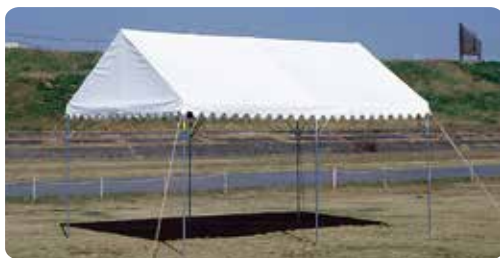
【設営時のテント2間×3間】奥行354×間口534×棟高304(cm)

パイプ：高張力鋼パイプ 31.8φ×1.4t(トップコートノンクロムタイプ透明塗装仕上げ) 生地：エステル帆布(防カビ加工) 付属品：杭4本、ロープ4本 重量：87kg ※単位はcmです。