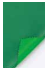
ダークグリーン × 若草