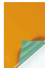
オレンジ × ライトグリーン