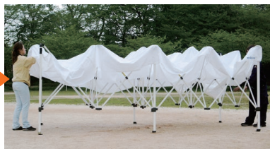
2.天幕をかぶせます