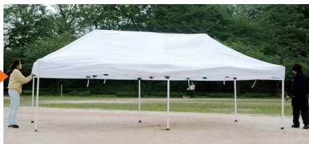
3.ジョイントをロックし高さを調整します