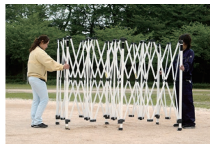
1.フレームを広げます